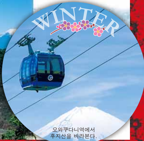
오와쿠다니역에서 후지산을 바라본다.