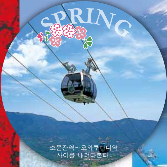
소운잔역~오와쿠다니역 사이를 내려다본다.