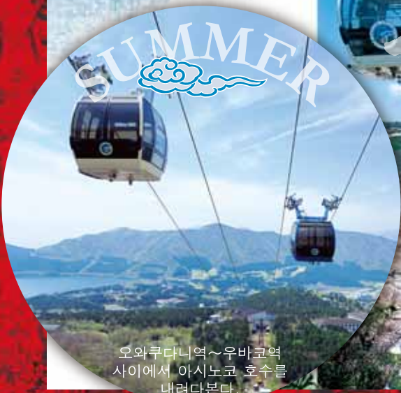
오와쿠다니역~우바코역 사이에서 아시노코 호수를 내려다본다.