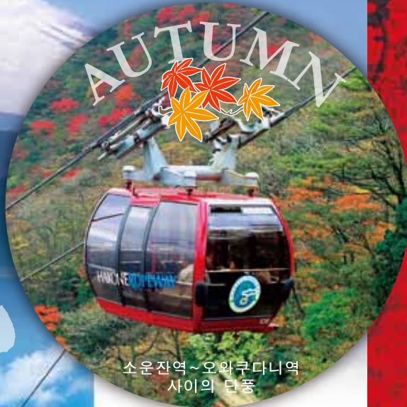
소운잔역~오와쿠다니역 사이의 단풍